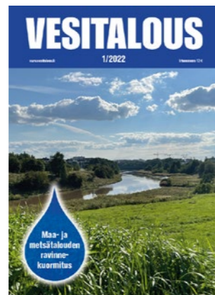
1/2022 Maa- ja metsätalouden vesistövaikutukset, Jukka Aroviita