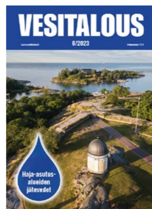
6/2023 Haja-asutusalueiden jätevedet, Vuokko Laukka