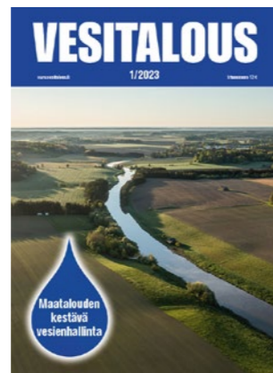
1/2023 Maatalouden kestävä vesienhallinta, Seija Virtanen