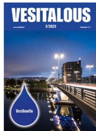
3/2023 Vesihuolto, Vesilaitosyhdistys