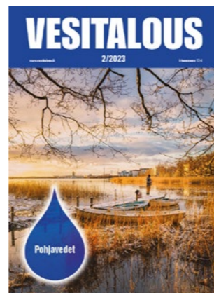
2/2023 Pohjavedet, Taina Nystén ja Pekka Rossi